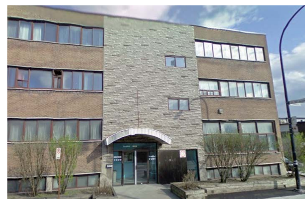
Centre communautaire musulman de Montréal