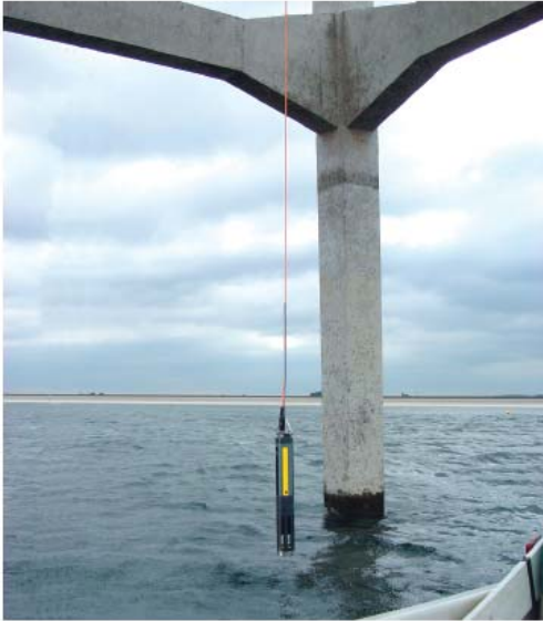
Figure 2 Dispositif permettant de suivre de façon automatisée la structure physique de la colonne d'eau et la localisation verticale des cyanobactéries, YSI Environmental, Angleterre.

Le réservoir Vir en République tchèque est un autre exemple de l'application d'une sonde à fluorescence où la profondeur de pompage de l'eau est déterminée en fonction de la qualité de l'eau à l'entrée de trois prises d'eau (Gregor et al. 2007). Ces sondes sont relativement abordables, avec un coût approximatif de $12,000 si elles incluent des senseurs de profondeur, de température, de pH, de conductivité, d'oxygène dissous et de fluorescence pour l'estimation de la biomasse totale (chlorophylle a ) et celle des cyanobactéries (phycocyanine).