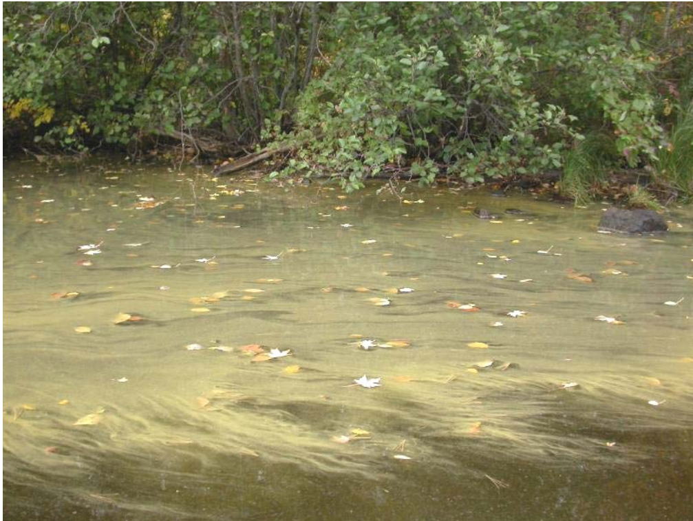
Fleur d'eau de cyanobactéries (surtout Microcystis sp).