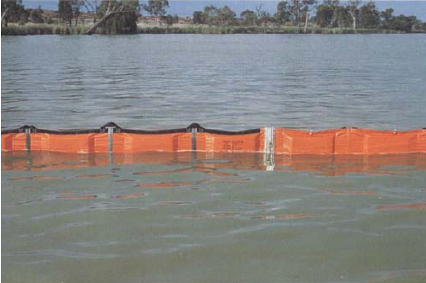
Figure 3 Barrière physique installée afin d'éviter que l'écume ne se déplace vers les prises d'eau (photo de Peter Baker, Australian Water Quality Centre). Tirée de Chorus & Bartram (1999).