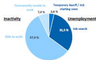
Distribution of NEET youth aged 17 to 34, by labor force status, Quebec 2018-2019

Data compiled by the Chaire-Réseau de recherche sur la jeunesse du Québec from Statistics Canada's Labour Force Survey (LFS) 2018-2019.