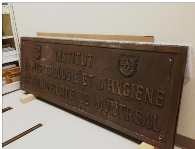
au frais dans une de nos réserves

C'est à partir de ce moment que le Service des archives et de la gestion documentaire de l'INRS intervient pour préserver ces objets. Bien que vos archivistes travaillent surtout sur... des archives (!), il peut arriver que des objets tridimensionnels soient aussi conservés en complément à notre patrimoine documentaire.